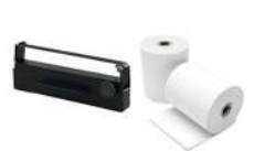
Rulo Kağıt / Kağıt Şerit