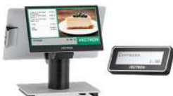
Müşteri Gösterge Ekranı