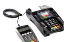
Ingenico IDE 280